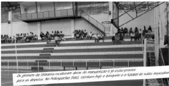
Os ginásios da Unisanta receberam obras de manutenção e já estão prontos para as disputas. No Poliesportivo (foto), estarão hoje o basquete e o futebol de salão masculino.

Já as faculdades disputam o concurso de quem arrecada mais alimentos. A vencedora recebe o Troféu de Solidariedade Universitária. Em 2008, o curso de Engenharia ficou em 1º lugar, seguido da Fisioterapia e da Farmácia, todas da UNISANTA. Este ano há uma novidade: a entrega de troféus para as três equipes mais organizadas e animadas. A entrega dos prêmios será no último dia de competição, previsto para 22 de maio.