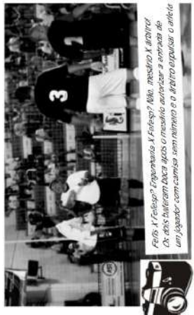
Por "Futebol" Experimento X Futebol? Não, mas não X futebol. Os dois jogadores ficam altos o mesquinho entretanto a entrada do um jogador com camisa sem número e o direito expulsar o outro.