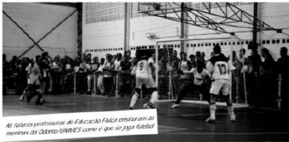
As futuras professoras de Educação Física exercitam as meninas da Odonto/UNIMES como é que se joga futebol

Na partida mais emocionante da noite, Farmácia/UNISANTA e a Faculdade de Educação Física/Unip duelaram em uma disputa de oito gols. Após duas viradas emocionantes, o empate por 4 a 4 no tempo normal levou a decisão para os pênaltis. O que veio a seguir foi a total falta de pontaria