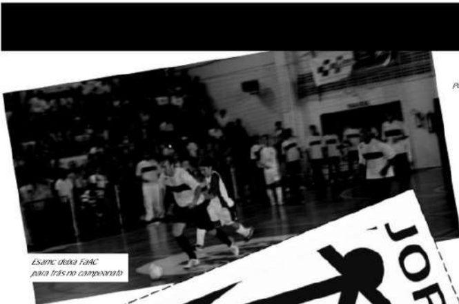
Esame de FaAC para três no campeonato