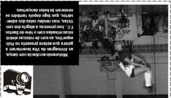
Misturando acrobacia com dança, as Alvinegras da Vila levantaram a plateia que estava presente no Poliesportivo, ao som de músicas eletrônicas mixadas com o hino do Santos F.C. Isso provocou a alegria dos santistas, mas rendeu valas dos adversários, que logo depois também se renderam às belas dançarinas.