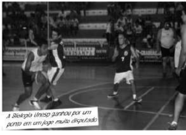
A Biologia Unesp partiu por um ponto em um jogo muito disputado.

O jogo anterior, entre Direito/UNISANTA e Administração/Unisantos, teve um clima bem mais frio. A torcida e os espectadores apareceram aos poucos. Realmente nada comparado ao segundo jogo. A equipe da UnSantos estava se saindo muito bem no primeiro período, mas devido a uma sequência incrível de erros deu a vitória à UNISANTA, que ganhou por 28 a 23, de virada. Os técnicos da Direito UNISANTA e da Unaerp não deram as caras.