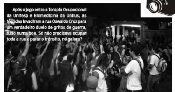
Após o jogo entre a Terapia Ocupacional da Unifesp e Biomedicina da Unilus, as torcidas invadiram a rua Oswald Cruz para um verdadeiro duelo de gritos de guerra. Tudo numa boa. Só não precisava ocupar toda a rua e parar o trânsito, né galera?