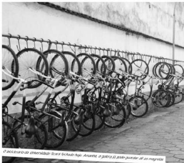
O bicicletário da Universidade ficará fechado hoje. Amanhã, a galera lá pode guardar as suas bicicletas

De acordo com Andreoli, para garantir a segurança dos Jogos, a UNISANTA terá o apoio da Polícia Militar e dos bombeiros. Haverá uma equipe interna de segurança composta pelos próprios funcionários da Universidade e outra circulando dentro do campus: "Nem disso, o sistema de monitoramento por câmeras será acionado na parte interna e externa dos ginásios, que já receberam obras de manutenção, como revisão elétrica, de extintores e limpeza". Uma equipe de paramédicos estará de plantão durante todo o torneio. No Bloco M, estarão à disposição duas ambulâncias para os atendimentos de emergência.