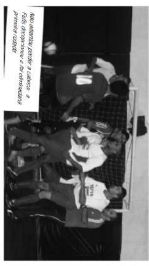
Não adiantou perder a liderança, a Felis desistiu e se entregou na primeira rodada.