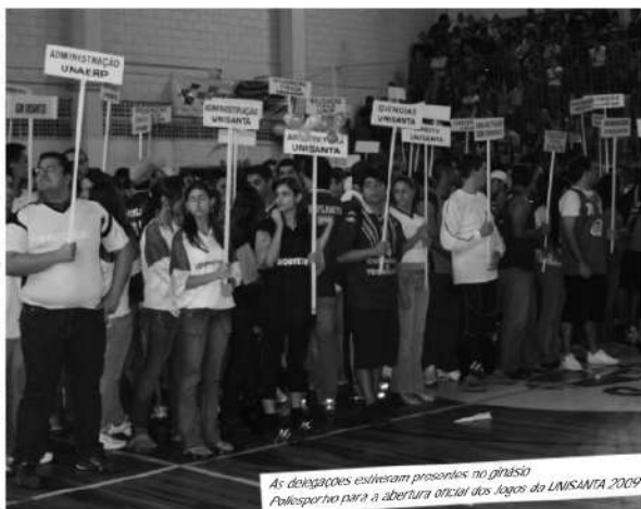
As delegações estiveram presentes no ginásio Poliesportivo para a abertura oficial dos Jogos da UNISANTIA 2009

O evento foi abrilhantado por apresentações do grupo de Jazz da Prefeitura de Mongaguá, da Ginástica Rítmica da Prefeitura de Santos, do grupo Sireel: Aclion, e das Alvinegras da Vila, as líderes de torcida do Santos F.C. A abertura contou também com uma grande apresentação do Estúdio de Dança sobre cadeiras de Rodas da Secretaria de Cultura de Santos, que levou a plateia ao delírio.