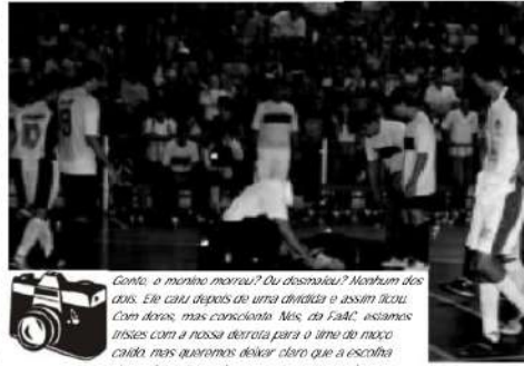
Gonzo, o morão morreu? Ou desmaiou? Nenhum dos dois. Ele caiu depois de uma disputa e assim ficou. Com dor, mas cancelado. Mas, da FaAC, estamos tristes com a nossa derrota para o time do moco canôto, mas queremos deixar claro que a escolha dessa foto não se deu por indagação ou recalcitração.

O apresentador desafiou, ainda, a coragem do goleiro da Unip na disputa mais violenta do jogo: "Ele tomou uma trombada na cabeça. Ou ele é macho ou é louco! Eu prefiro a primeira hipótese!", brincou. Apesar do resultado, o comentarista frisou a qualidade do jogo: "Foi maravilhoso, muito bom tecnicamente!".