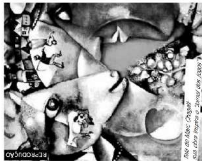
Foto de Marc Chagall sua obra inspira o Jornal dos Jogos

Relaxar você não está com la-bimille. A sensação de tontura ao ler o Jornal dos Jogos, o J.J., é por que, de fato, ele está de cabeça para baixo. Sabemos que muita gente se incomoda com isso, pois considera o jornalismo coisa séria e prefere o modo habitual de ler. Tudo bem, mas uma das nossas propostas é divertir-lo. Sem dizer que o J.J., que este ano completa 11 anos, é um jornal-laboratório preocupado em testar novas linguagens para se comunicar com o público. Agora, observe o melhor. Essa concepção gráfica por acaso não lembra as telas de Marc Chagall (1887-1985), aquele pintor francês precursor do surrealismo? Pois é, a obra desse magnífico artista nos inspira sempre.