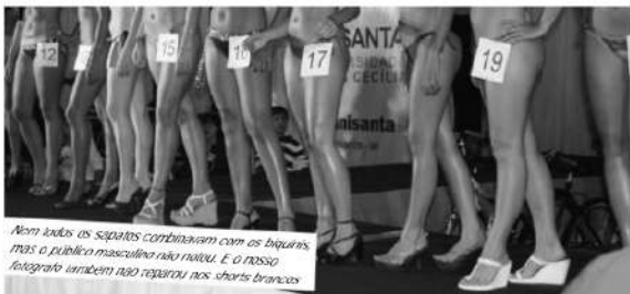
Nem todos os sapatos combinavam com os biquinis, mas o público masculino não notou. E o russo fotografou também nos shorts brancos

A harmonia foi outra característica que, na maior parte do tempo, mandou beijos lá de longe. Era biquini básico com sapato de festa, meda praia com strass e muita prata, pernas grossas com salto fino... Mas tudo bem! O que interessava, mesmo, era evidenciar os atributos. Estão perdoadas.